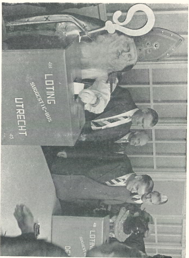
Directie en bedrijfsleiding hebben zich om de suggestiebussen geschaard, waaruit Sinterklaas de loten van de prijswinnaars haalt.

Je hebt van die mensen, die zich telkens ijertig voor anderen wilstoven. O, zij hebben het zo erg goed met die anderen voor. Het is evenwel vaak de vraag, of die anderen werkelijk behoefte hebben aan en gekijktig zijn met wat hun aldus enthousiast wordt geboden. Dat is heus niet alleen tijdens de Sinterklaas zo; dat komt het gehele jaar door voor. Deze lieden kunnen zo van veldadigheid en goede bedoelingen met anderen overlopen, dat die anderen er ineens dit genoege van krijgen. En dan krijt die goede-bedoeler zijn verrassing: ze zijn hem beu! En loch: Love de Sint! Kom elk jaar terug! Schevver Sr.